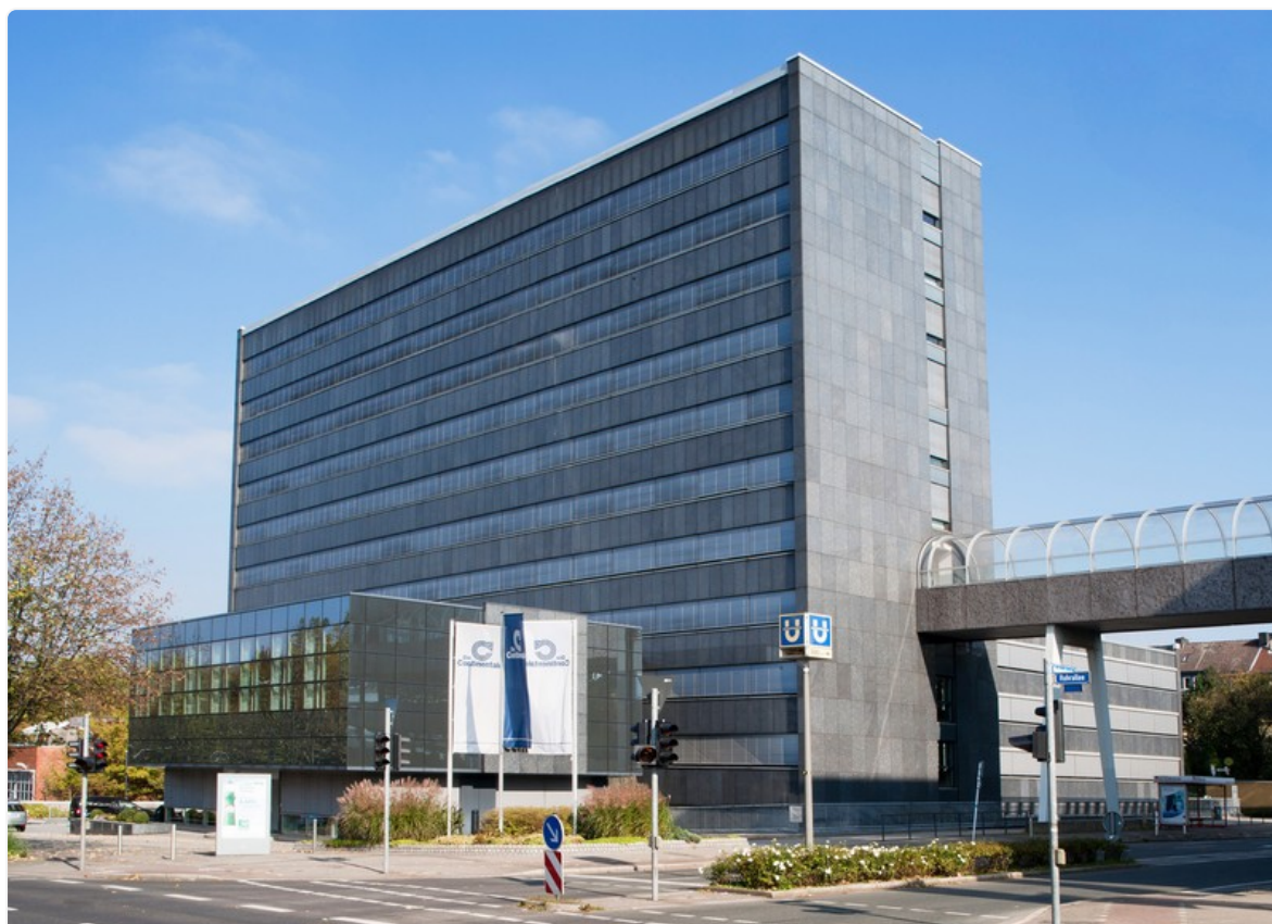
Continentale Versicherungsverbund Direktion Dortmund, Ruhrallee 92

Bevor das Neujahrsfeuerwerk beginnt, können Vermittler für ihre Kunden in der Altersvorsorge noch Beitragsvorteile von bis zu 15 Prozent sichern. Bis Mitternacht nimmt die Continentale Lebensversicherung am 31. Dezember Anträge an - sofern eine vom Kunden unterschriebene bedingte Annahmeerklärung beiliegt. Für vordatierte Anträge gilt als spätester Versicherungsbeginn der 1. März 2017.