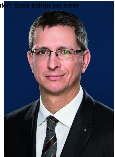
Rechtsanwalt Norman Wirth

Wenn die Strafe aber – wie tatsächlich in der IDD festgeschrieben - maximal mindestens 700.000 Euro betragen soll, heißt das, sie kann von 0 Euro Geldstrafe bis zu maximal 700.000 Euro Geldstrafe betragen. Der deutsche Gesetzgeber dürfte also nicht festlegen, dass die Maximalsanktion nur 500.000 Euro betragen soll. Wobei aber durch das „maximal mindestens“ dem jeweiligen nationalen Gesetzgeber die Möglichkeit gelassen wird, die Maximalstrafe noch höher als die 700.000 Euro zu setzen. Im deutschen Gesetzgebungsverfahren könnte also entschieden werden, dass die Maximalsanktion 1 Mio Euro betragen soll.